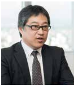
認定登録医業経営コンサルタント