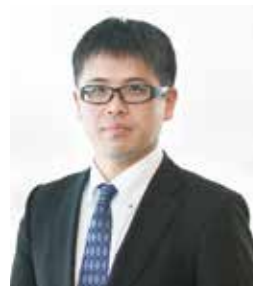
認定登録医業経営コンサルタント

医療法人の事業承継相談に長年関わっており、医療法人制度に精通している。特定医療法人化や旧認定医療法人制度を活用した持分なし医療法人への移行など、個別ニーズに合わせた承継対策の立案・実行支援を多数実施している。