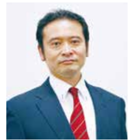
認定登録医業経営コンサルタント

持分なし医療法人移行を含む事業承継対策やM&Aコンサルティングを中心に活動している。また、事業承継や医療法人制度をテーマとした刊行誌の執筆や税理士・金融機関向けのセミナーを多数実施している。