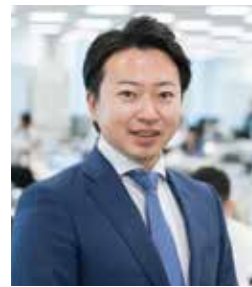
認定登録医業経営コンサルタント

医療機関や介護施設の会計顧問を長年担当しており、コンサルティング業務だけでなく税務会計業務にも精通している。特に医療法人制度については、設立手続・定款変更・出資金対策等を近年は主要な業務として行っており、持分なし医療法人への移行も支援実績がある。