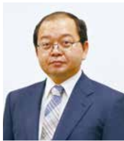
認定登録医業経営コンサルタント

入社以来20年に亘り、医療機関・介護事業所を専門として担当し、税務分野の相談業務だけでなく、収益改善・業務改善・新事業展開・事業承継などのコンサルティングを行っている。 これまで、関わった案件数は、300施設を超え、最近では中小病院向けの事業承継対策・出資金対策を中心に活動している。